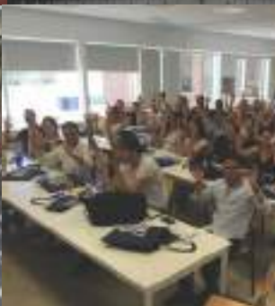
Oír con la vista