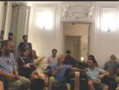
Visita estudio Vicens+Ramos