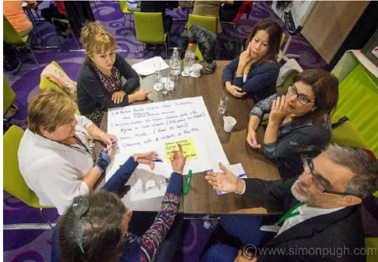
Visita informativa a la Comisión Europea de la Delegación de “EU networks” en España. Comisión Europea, Bruselas. 14 y 15 de noviembre.